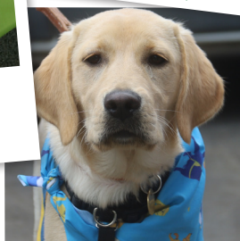
et de nos héros à 4 pattes