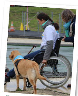
Présentation du rôle de chien d'assistance