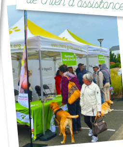
Stand familles d'accueil