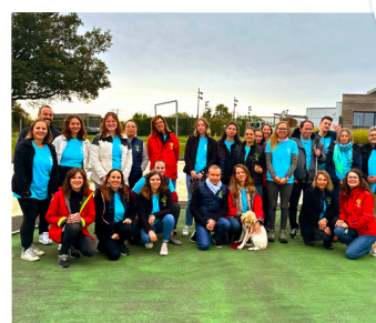
Notre équipe de salariés