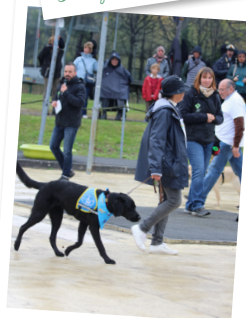
Démonstration des familles d'accueil