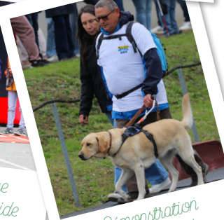
Démonstration de chien guide