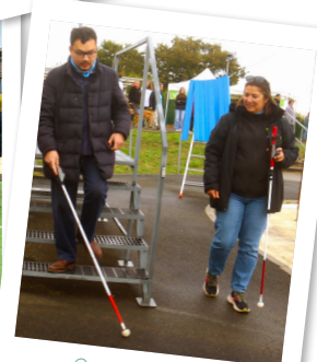
Démonstration de canne blanche électronique