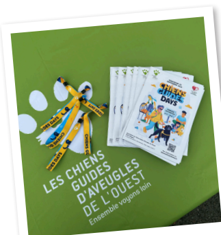
Les Chiens Guides Days