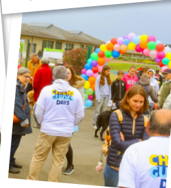
Stand Maison du Christ