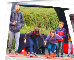
Parcours d'athlétisme sous bandeau, avec guide